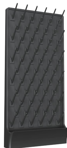
型号: KD 9