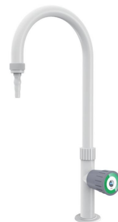
型号: KA 6-1

单口鹅颈纯水化验龙头安装于水槽台，常用于实验仪器接水、试管、器皿清洗等等。主体PP材质，保障水质不受污染及臂接触金属材料，鹅颈弯管可360°旋转，出水嘴设计为可以插皮管的尖嘴型。