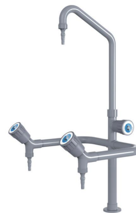
型号: KA 1-3